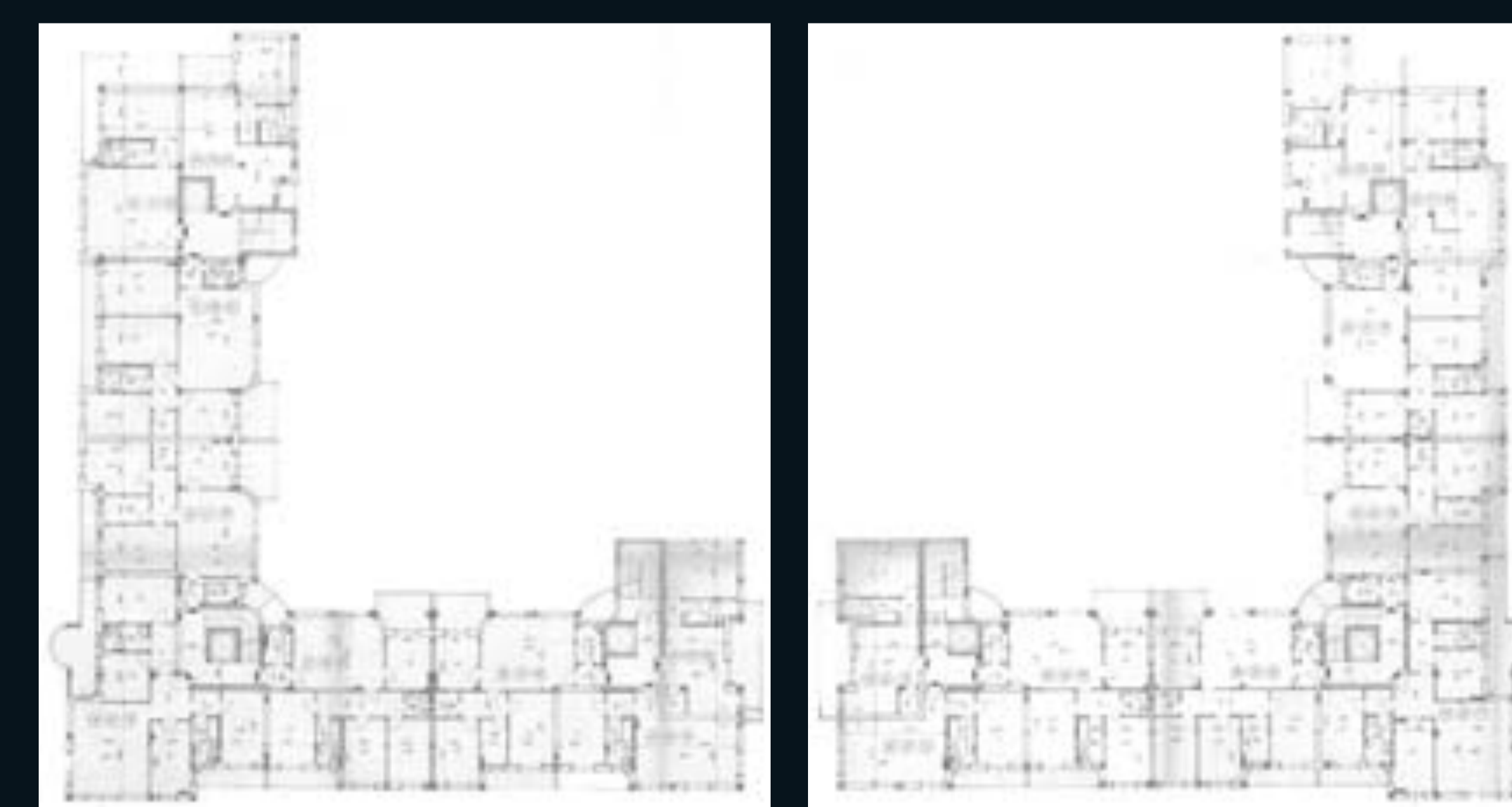
Pianta piano tipo