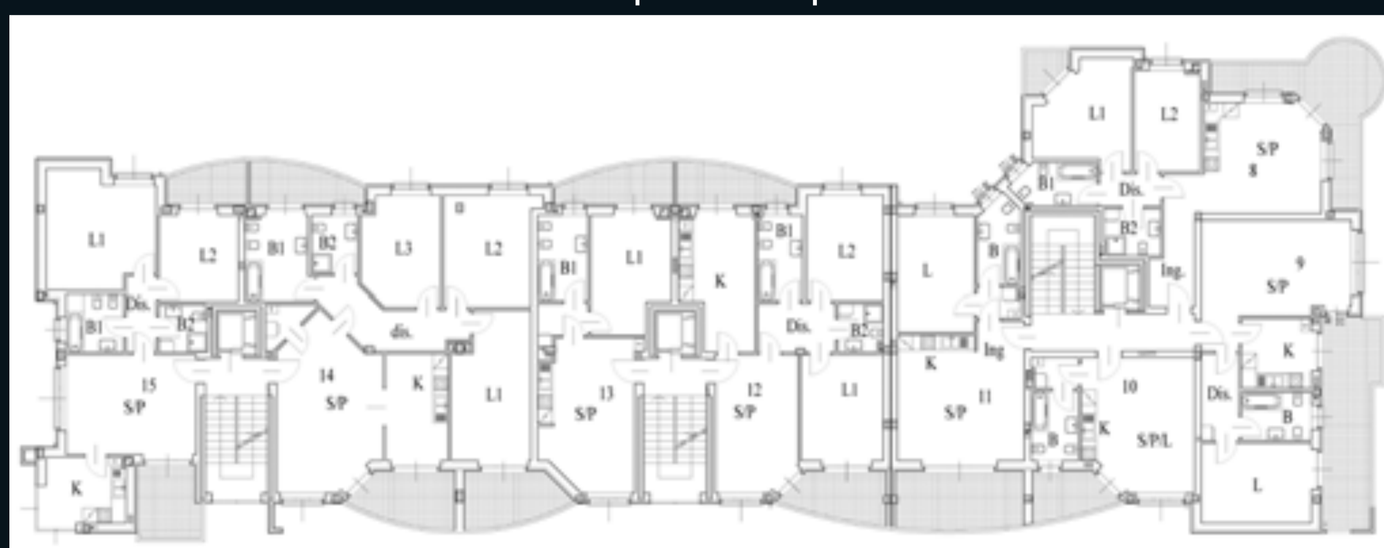
Pianta piano secondo